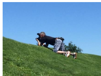
Paparazzi: Martin Sax Foto: Giancarlo Stefani

Der SGA-Paparazzi schlich dann hie und da um die Greens und erhoffte sich den einen oder anderen Schnappschuss. Die Teilnehmer sind sich dies ja gewohnt und sind fast schon enttäuscht, wenn er nicht irgendwo in ihrer Nähe auftaucht. Bei dieser «Spionagerunde» viel dem Fotografen ein junges Talent immer wieder auf. Ein Neumitglied in den Reihen der SGA und ein Golfspieler der besonderen Art. Es sollte dann auch so sein, dass dieser Name bei der Rangverkündung als erstes genannt werden sollte.