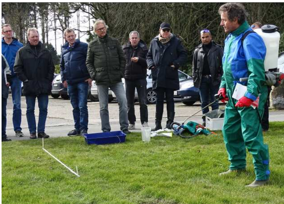
Abb.4: Aufmerksame Seminar-Teilnehmer bei den Erläuterungen zum Umgang mit der Rückenspritze. Anwender mit Schutzkleidung.

An der zweiten Station wurden Maßnahmen zum Anwenderschutz (Schutzanzug, Handschuhe, Brille, Atemmaske etc.) vorgestellt und erläutert. Darüber hinaus standen das Auslitern einer Rückenspritze sowie Düsenabstand zum Boden und Laufgeschwindigkeit auf dem Programm.