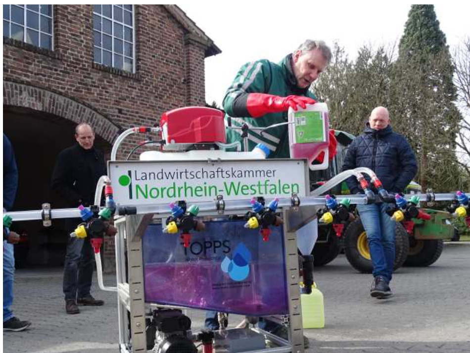
Abb.2: Demonstration des geschlossenen Befüllsystems an der Spritze.

Am Nachmittag erfolgte an zwei Stationen die praktische Vorstellung zur Ausstattung von Spritzgeräten (Flächenspritze/Rückspritze). Wichtige Kriterien wie Wasseraufwandmengen, Spritzdruck, Tröpfchengröße, Düsenauswahl bis hin zum geschlossenen Befüllsystem und zur Innenreinigung wurden an dem gläsernen Spritzenmodell der Landwirtschaftskammer NRW erläutert und real umgesetzt.