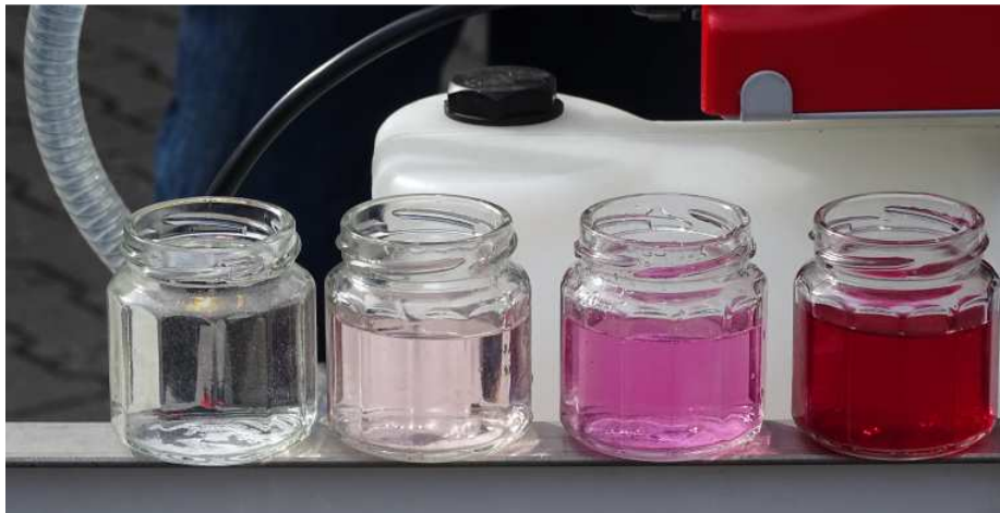
Abb.3: Ergebnis der Innenreinigung wird nach wenigen Spülgängen in den Schaugläsern sichtbar. (Rote Beete-Saft).

Die Innenreinigung des Tanks wurde anschaulich mit Hilfe von Rote Beete Saft und unter Einsatz eines auf der Spritze integrierten kontinuierlichen Innenreinigungssystem verdeutlicht.