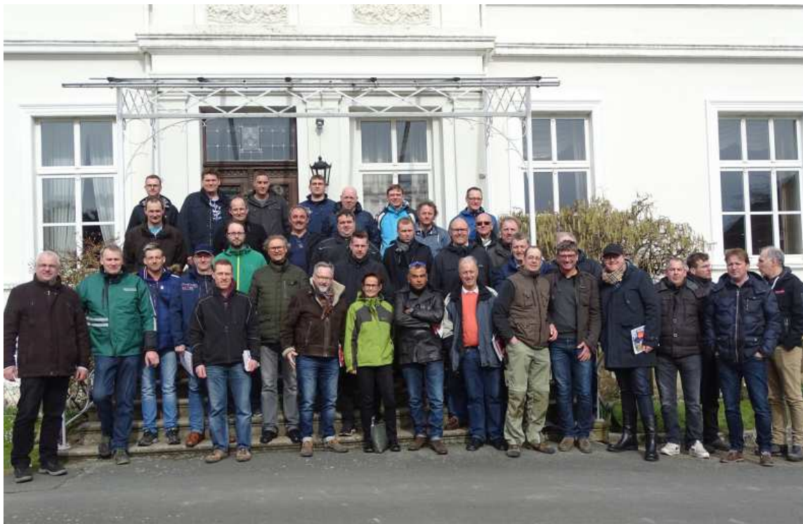
Abb.6: Greenkeeper-Teilnehmer beim Sachkunde-Seminar auf der Golfanlage Gut Neuenhof in Fröndenberg.

Als Seminar-Teilnehmer kann sich der Berichterstatter dem positiven Feedback durch die Greenkeeper nur anschließen. Das Format dieser Veranstaltung ist sehr geeignet, das Thema Pflanzenschutz im Golf- und Sportrasen sehr effektiv auf den neuesten Stand zu bringen. Dabei wurde eine gelungene Kombination aus Forschung und Beratung mit praktischen Anwendungshinweisen für den sachkundigen Einsatz von Pflanzenschutzmitteln gefunden. Diese Veranstaltung zur Sachkunde war beispielhaft!